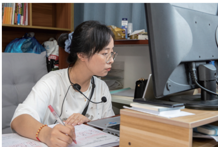
9点30分 教师备课、改卷