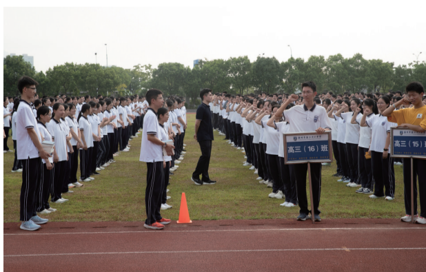
7点50分 高三学子喊励志口号