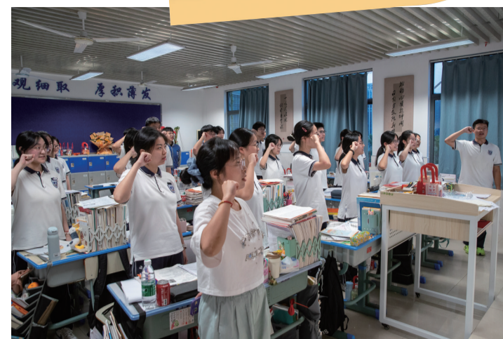
18点05分 高三学生喊励志口号