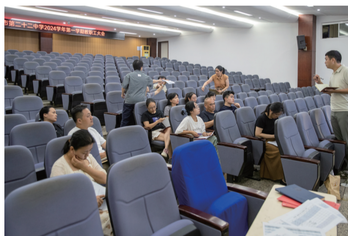
15点20分 高三段班主任会议