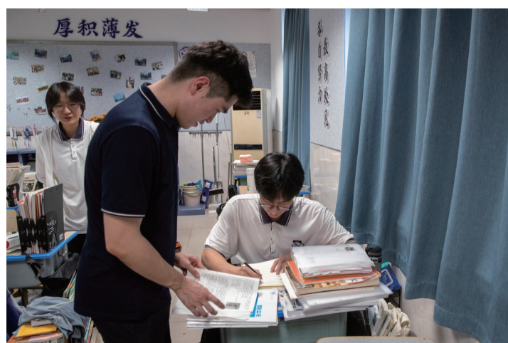
17点50分 进教室巡查学生晚自修前的准备情况