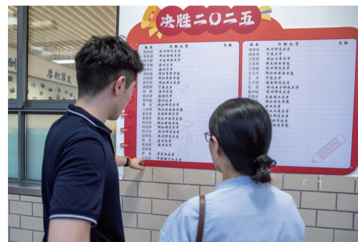
18点20分 和家长沟通学生情况