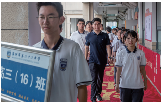
7点 前往操场参加晨会