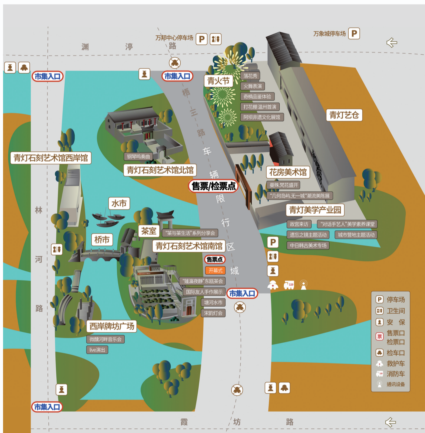
仅供参考,以开市后实际布局为准